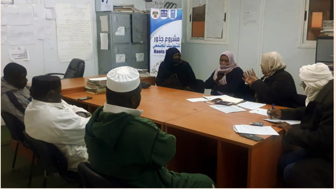
مناقشة جماعية مركزة (فوكس جروب) ضمن مشروع جمعية ازجر بعنوان جذور للتماسك المجتمعي في اوباري

مرحباً بكم في النسخة التاسعة من رسالتنا الإخبارية!